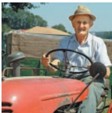
Durch Vorsorge finanziell sorgenfrei im Alter leben.

Die Beiträge für die AHV/IV (1. Säule) stützen sich auf die Steuerbuchhaltung des Betriebs. Daher gibt es wenig Gestaltungsspielraum, welchen Umfang dieser Teil der Altersvorsorge haben soll. Die 1. Säule ist darauf ausgerichtet, die Existenzgrundlage abzusichern. Die für Arbeitnehmende obligatorische 2. Säule fehlt bei den