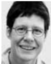
Daniela Clemenz, UFA-Revue, 8401 Winterthur

STRUKTURVERBESSERUNGEN Im Jahr 2005 wurden Bundesbeiträge (à fonds perdu) im Umfang von 85 Mio. Franken verwendet für Bodenverbesserungen und landwirtschaftliche Hochbauten. Im gleichen Jahr wurden 2185 Investitionskredite, d. h. zinslose Darlehen, von insgesamt 320.3 Mio. Fr. für Wohn- und Ökonomiegebäude, Baukredite und für die Starthilfe bewilligt. Was muss ein Landwirt tun, um Zugang zu diesen Bundesgeldern zu haben?